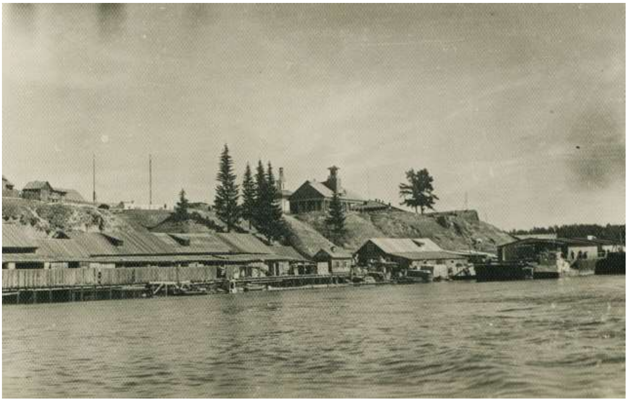
Береговая зона поселка Октябрьское в районе пристани с деревянными постройками складов райрыболовпотребсоюза. [1970-е годы].

Архивный отдел администрации Октябрьского района. Фонд Фотодокументов. Опись 1. Дело 554.