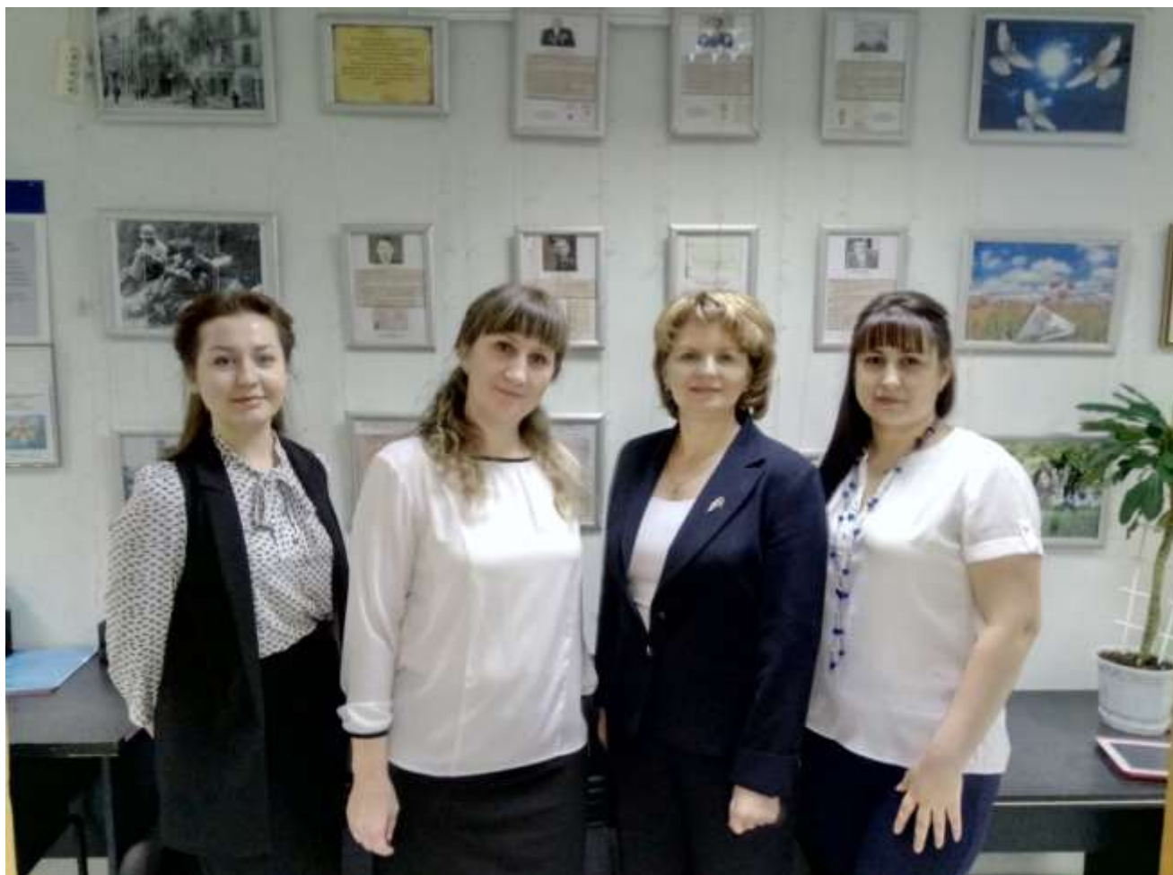
Коллектив Октябрьского районного архива

ЭТА ЮБИЛЕЙНАЯ ДАТА ЯВЛЯЕТСЯ ВАЖНОЙ НЕ ТОЛЬКО ДЛЯ АРХИВИСТОВ ОКТЯБРЬСКОГО РАЙОНА, НО И ДЛЯ ВСЕХ ТЕХ, КТО НЕ РАВНОДУШЕН К СОХРАНЕНИЮ И ИЗУЧЕНИЮ ИСТОРИИ РОДНОГО КРАЯ. В ЭТОТ ЗАМЕЧАТЕЛЬНЫЙ ДЕНЬ АРХИВНЫЙ ОТДЕЛ АДМИНИСТРАЦИИ РАЙОНА ИСКРЕННО БЛАГОДАРИТ И ПОЗДРАВЛЯЕТ ВСЕХ ТЕХ, КТО ПРИЧАСТЕН К ЭТОМУ ЮБИЛЕЮ.