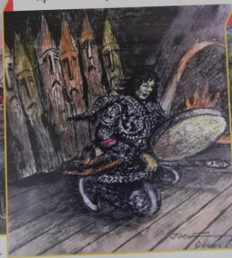
▶ «Чёрный шаман»