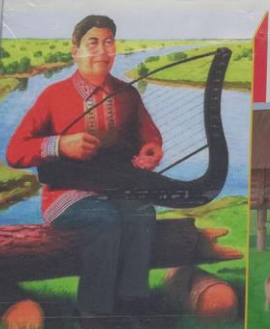
▲ «Мелодия торсаптыоха»