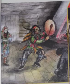
▲ «Белый шаман»