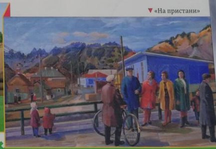
▼ «На пристани»