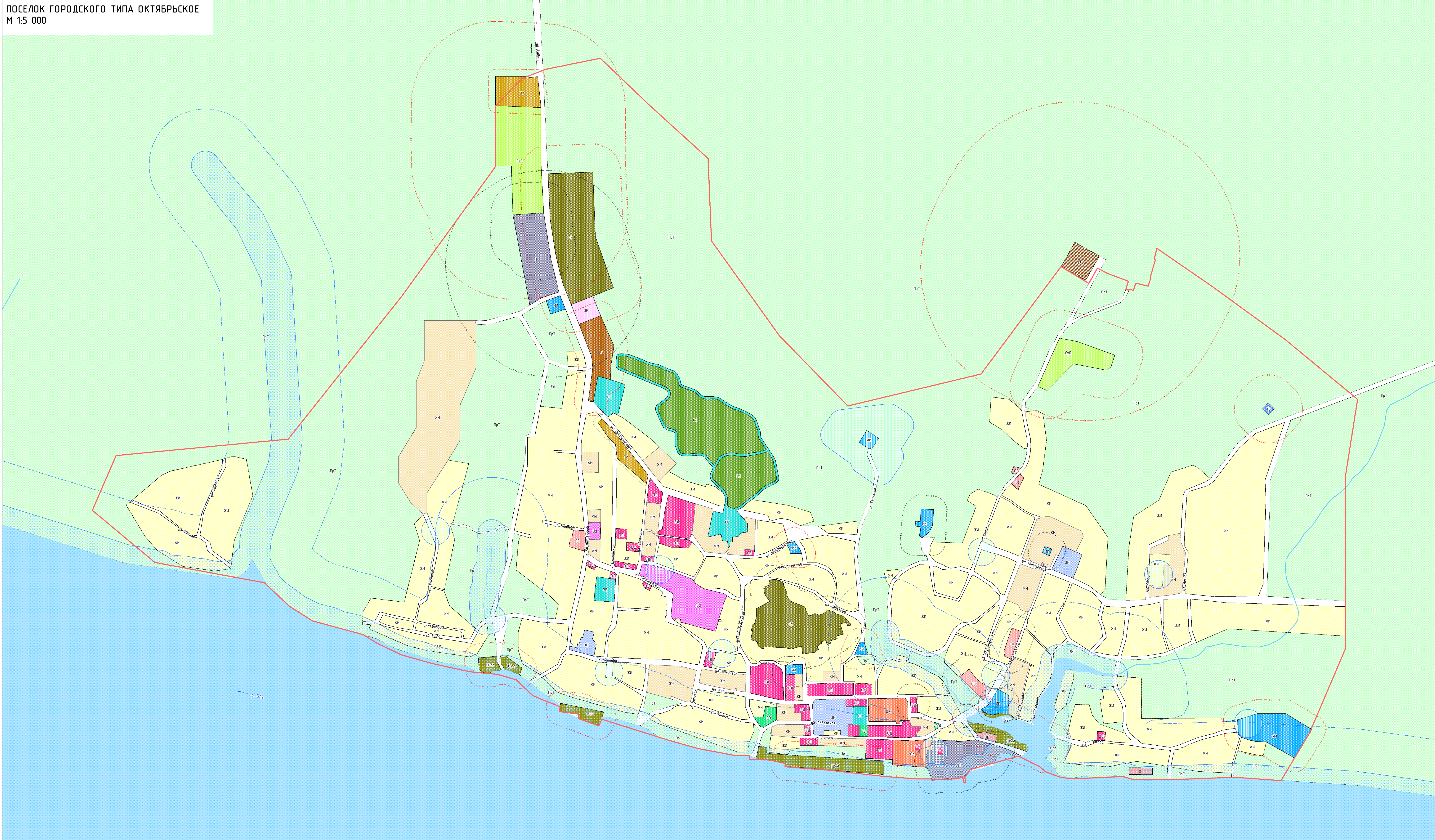
ПОСЕЛОК ГОРОДСКОГО ТИПА ОКТЯБРЬСКОЕ М 1:5 000