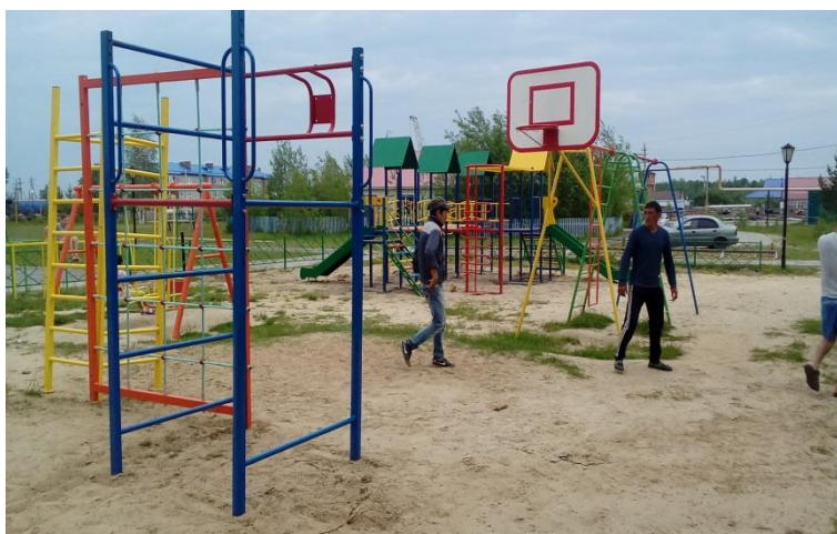
Детский игровой комплекс п. Сергино (1700 жителей)