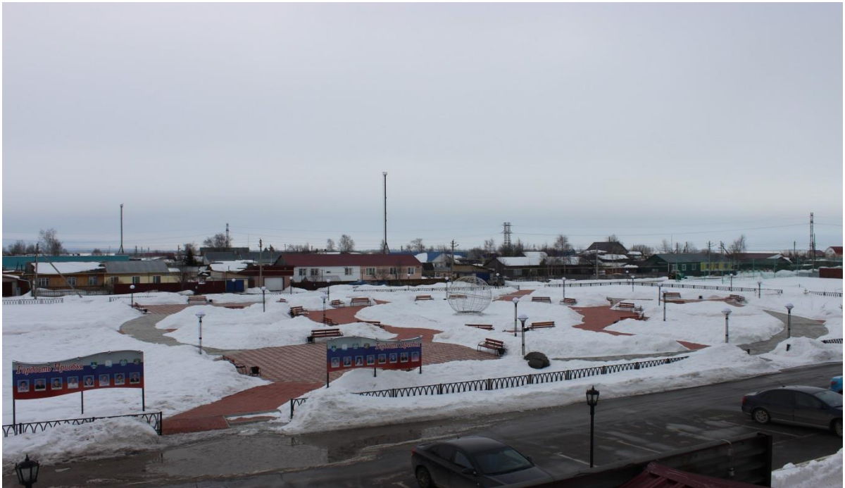
Парк отдыха весной.

Объект расположен в центре населенного пункта (автор проекта Матюнин С. М.) Основная задача парка — организовать активный отдых жителей и гостей поселка в природной среде, удовлетворить их стремление к приключениям, к творческим занятиям, экспериментированию. Вход в парк располагается с учетом архитектурно-планировочной организации городского поселения и направления потоков движения посетителей. Перед парком предусматривается площадь для остановок общественного транспорта, распределения посетителей и стоянки автомашин.