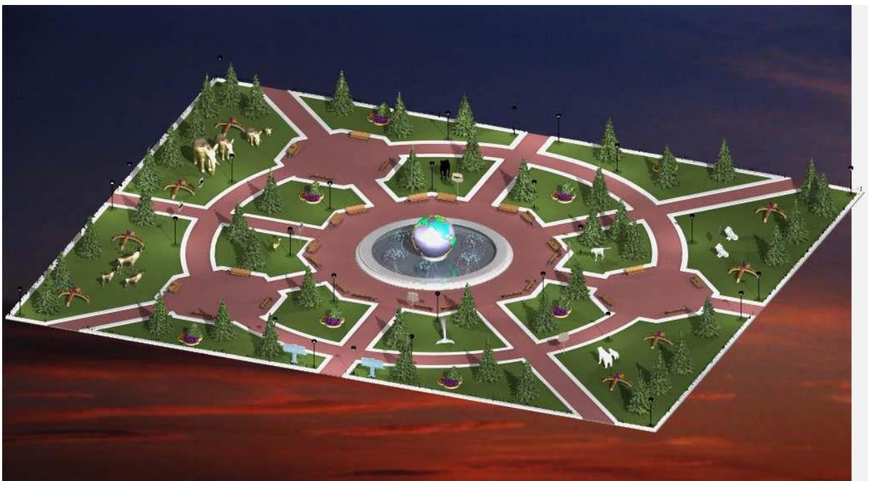
Эскиз парка отдыха!

Стоимость обустройства объекта составляет 8227,925 тыс. руб. (дополняется)