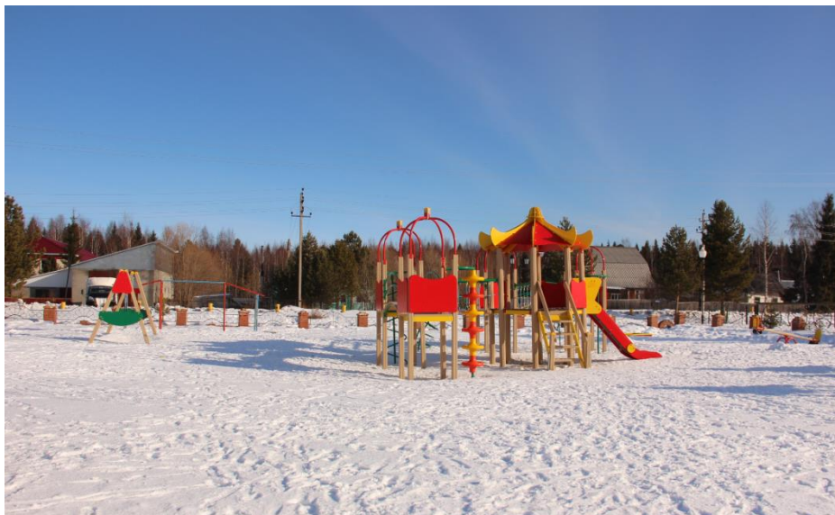
Детский игровой комплекс, с. Перегребное, ул. Таежная. (3617 жителей)