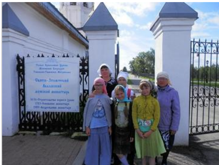
Абалак. Вход в монастырь

В первый день нашего пребывания в Тобольске мы отправились в Кремль, где в Софийско-Успенском соборе приложились к мощам святителя Иоанна Тобольского и священномученика Гермогена. Помимо храма мы побывали в тобольском музее, расположенном в Дворце наместника, а также в музее сибирского предпринимательства.