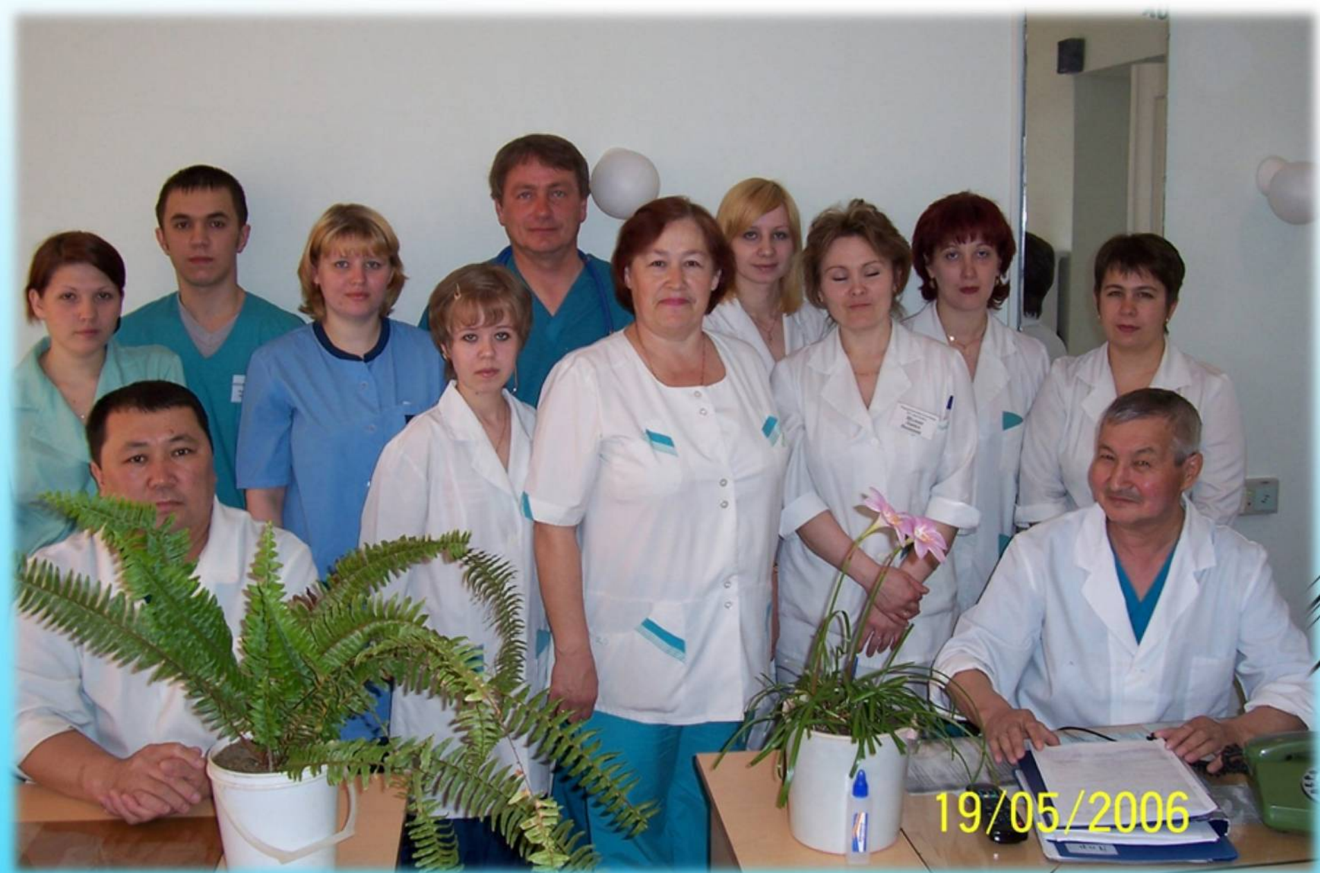
Коллектив хирургического отделения Октябрьской больницы, 2006 год.