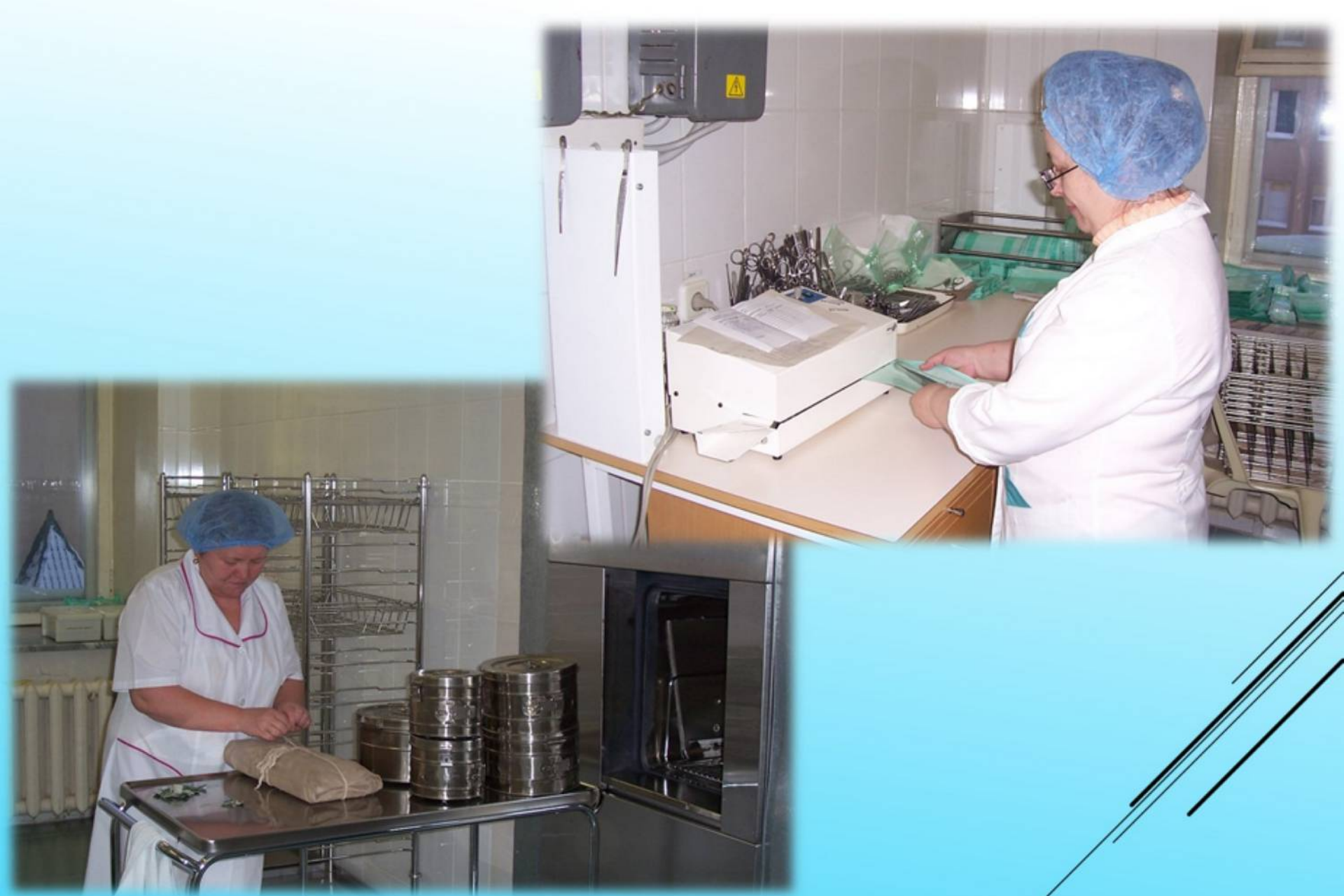
Медицинские работники стерилизационного отделения Октябрьской больницы, 2006 год