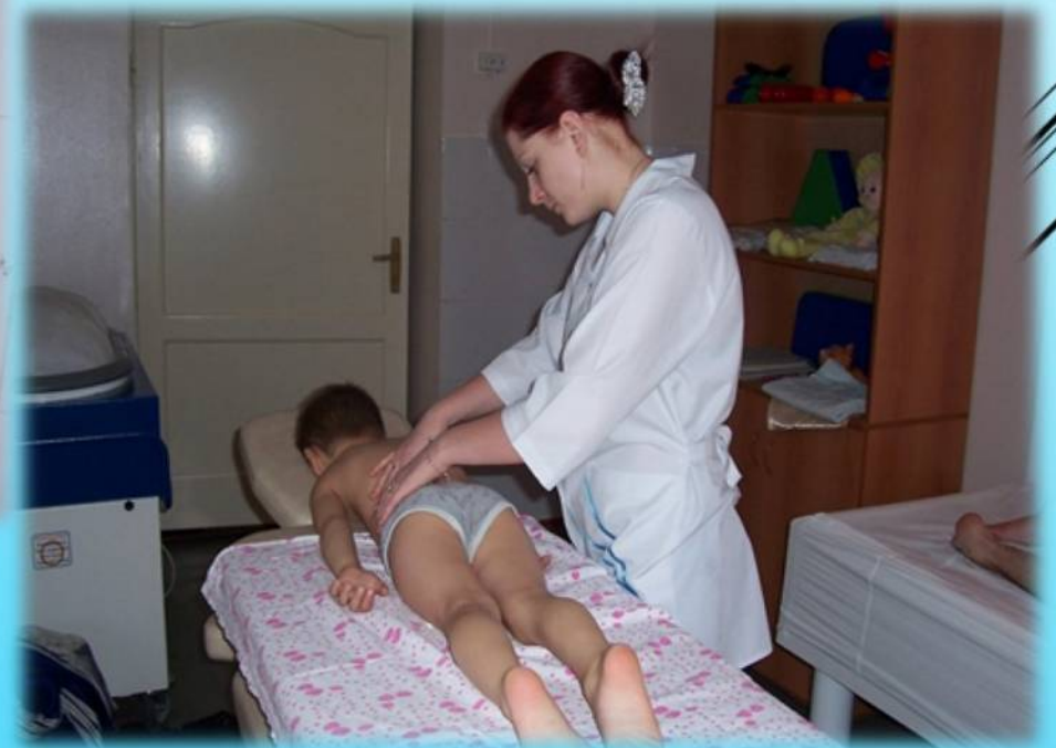
Медицинские работники детского отделения Октябрьской больницы во время проведения реабилитационных процедур детям, 2006 год