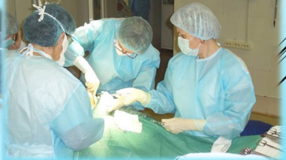
Медицинские работники хирургического отделения Октябрьской больницы во время оперативных вмешательств, 2004 год