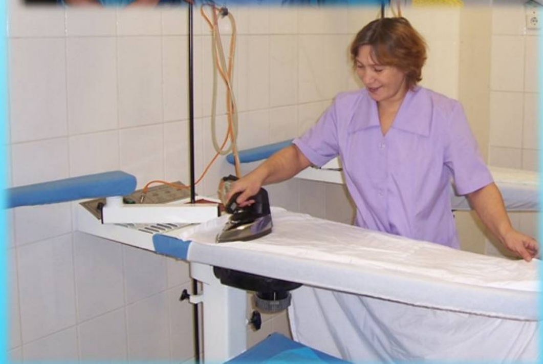
Работники прачечной Октябрьской больницы, 2006 год