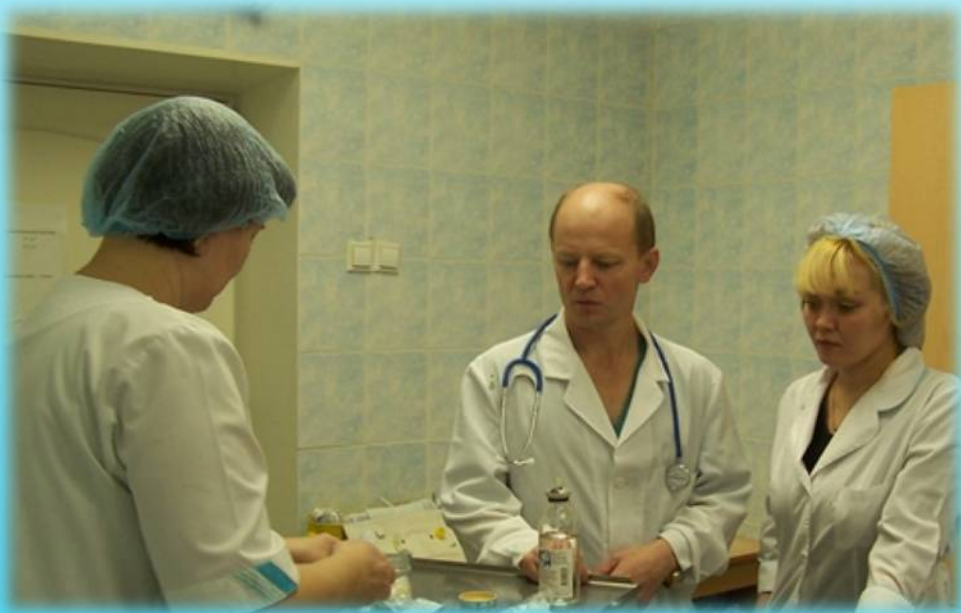
Медицинские работники отделения реанимации Октябрьской больницы, 2006 год