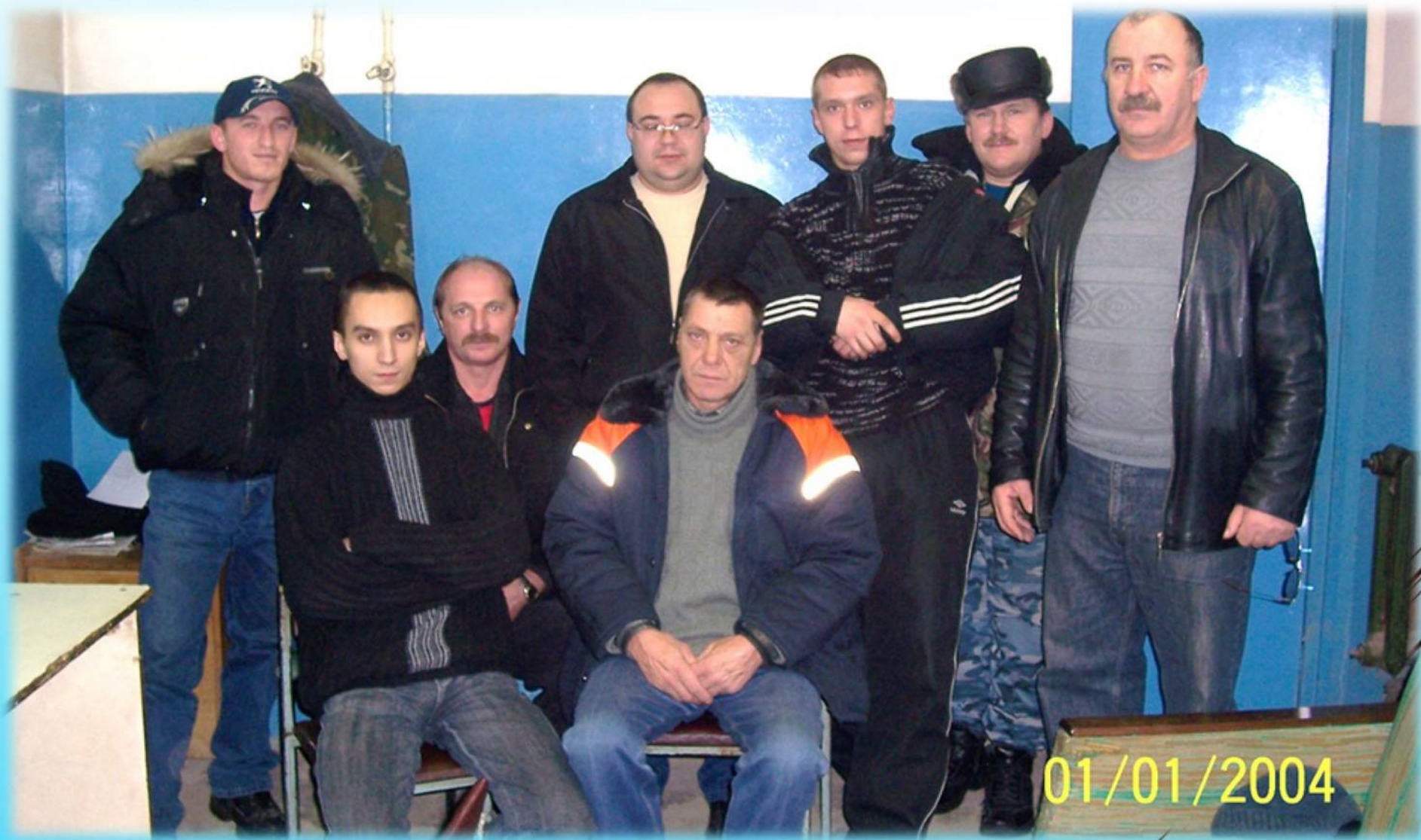
Водители Октябрьской больницы, 2004 год