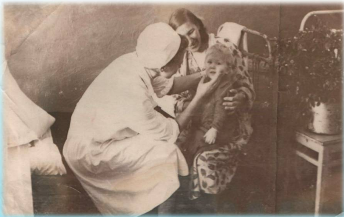
Фотодокумент 1960 года КУ «Государственный архив Югры»