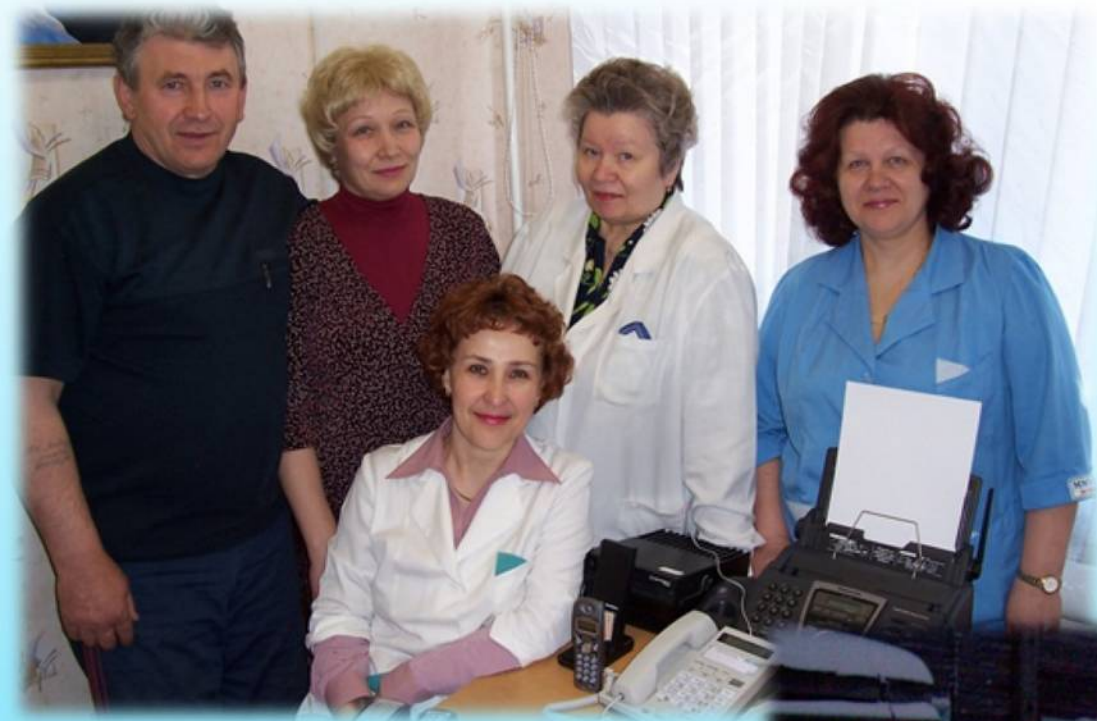
Медицинские работники Октябрьской больницы отделения скорой помощи, 2006 год