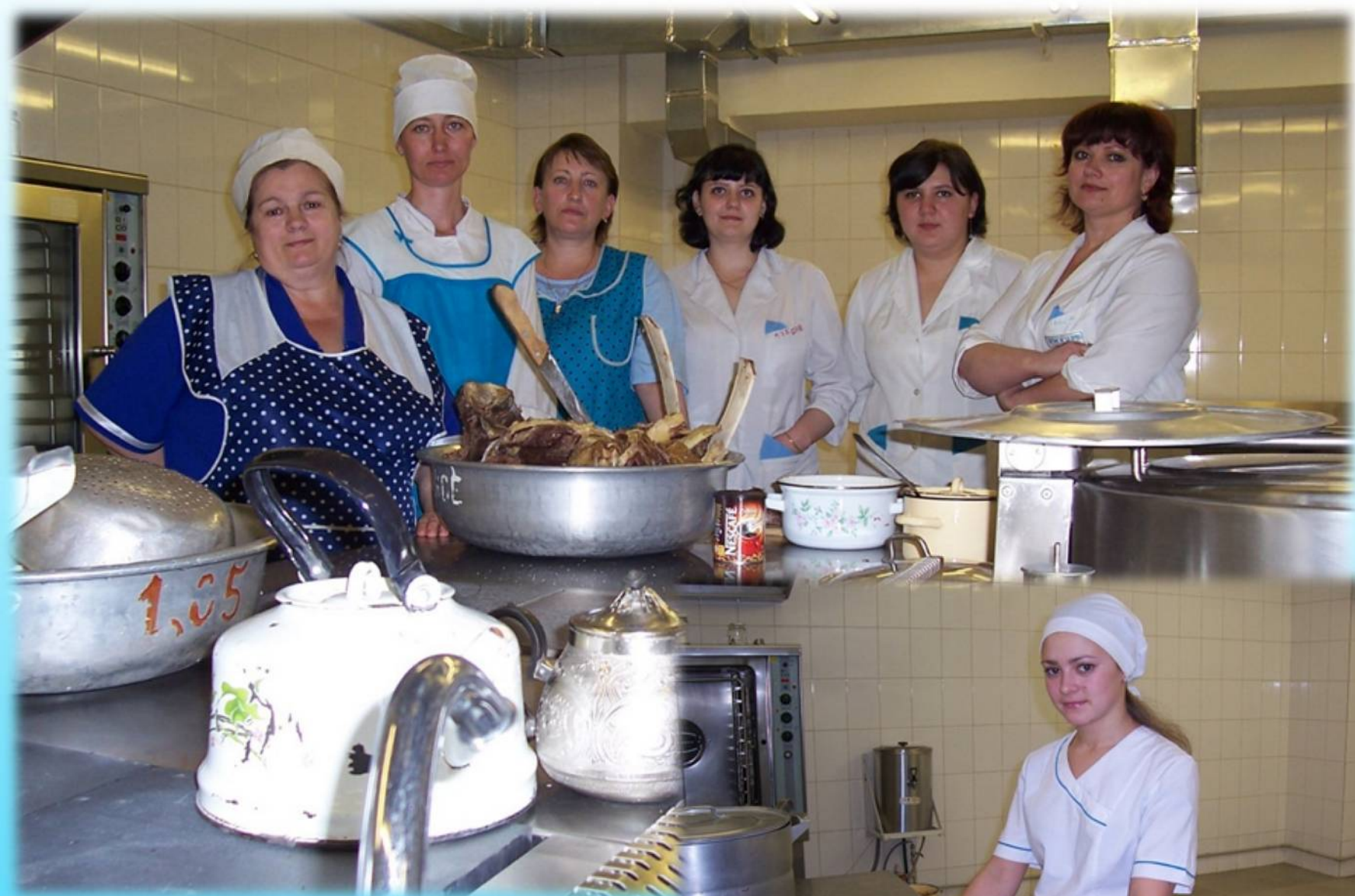
Работники пищеблока Октябрьской больницы, 2006 год