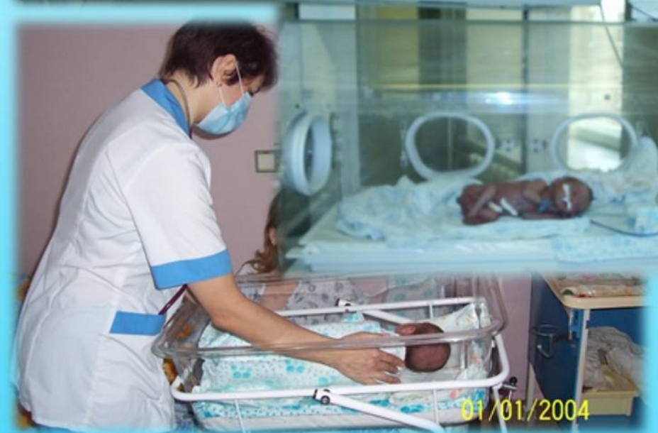
Медицинские работники родильного отделения Октябрьской больницы во время обследования новорожденных, 2004-2006 годы