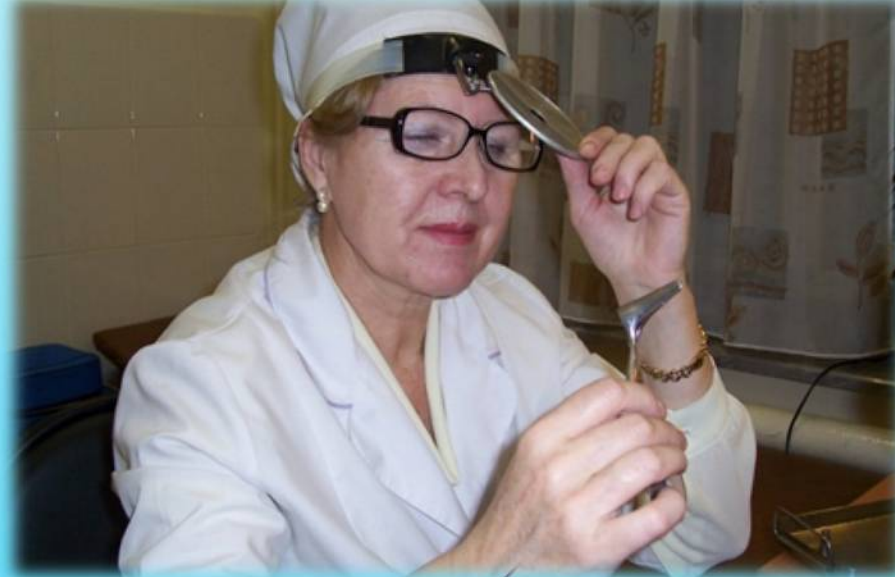
Медицинские работники Октябрьской районной поликлиники, 2007 год