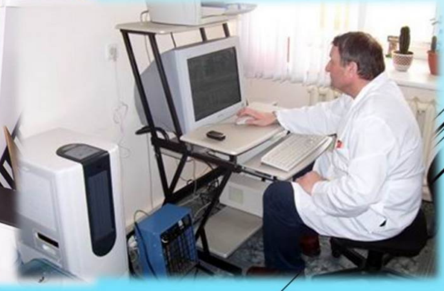
Цифровой широкоформатный флюорограф, аппарат для чтения результатов флюорографии, маммограф «Альфа III», 2007 год