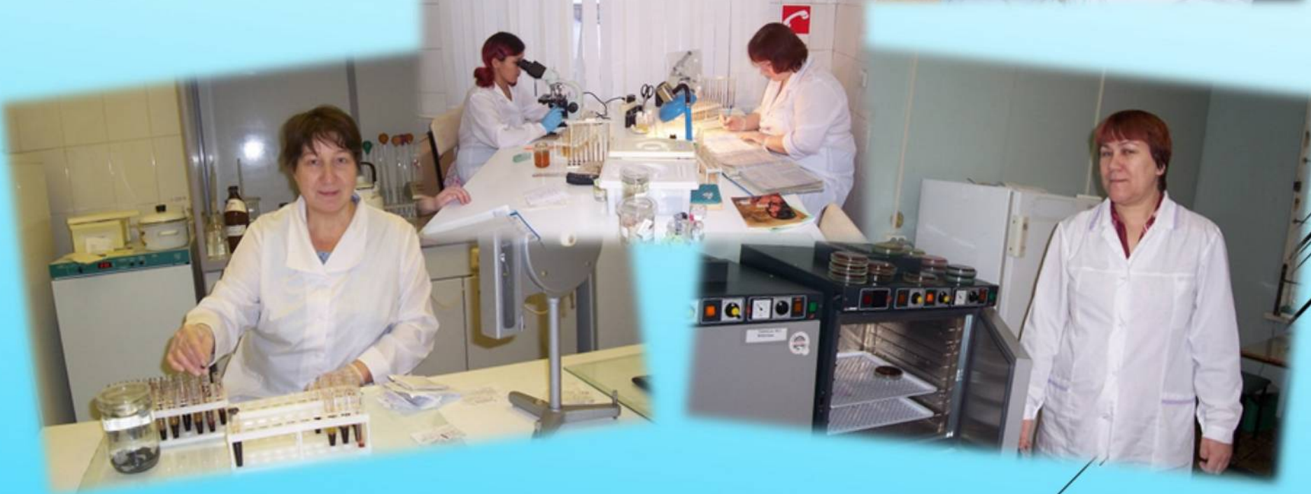
Медицинские работники клинической лаборатории Октябрьской больницы во время проведения исследований, 2007 год