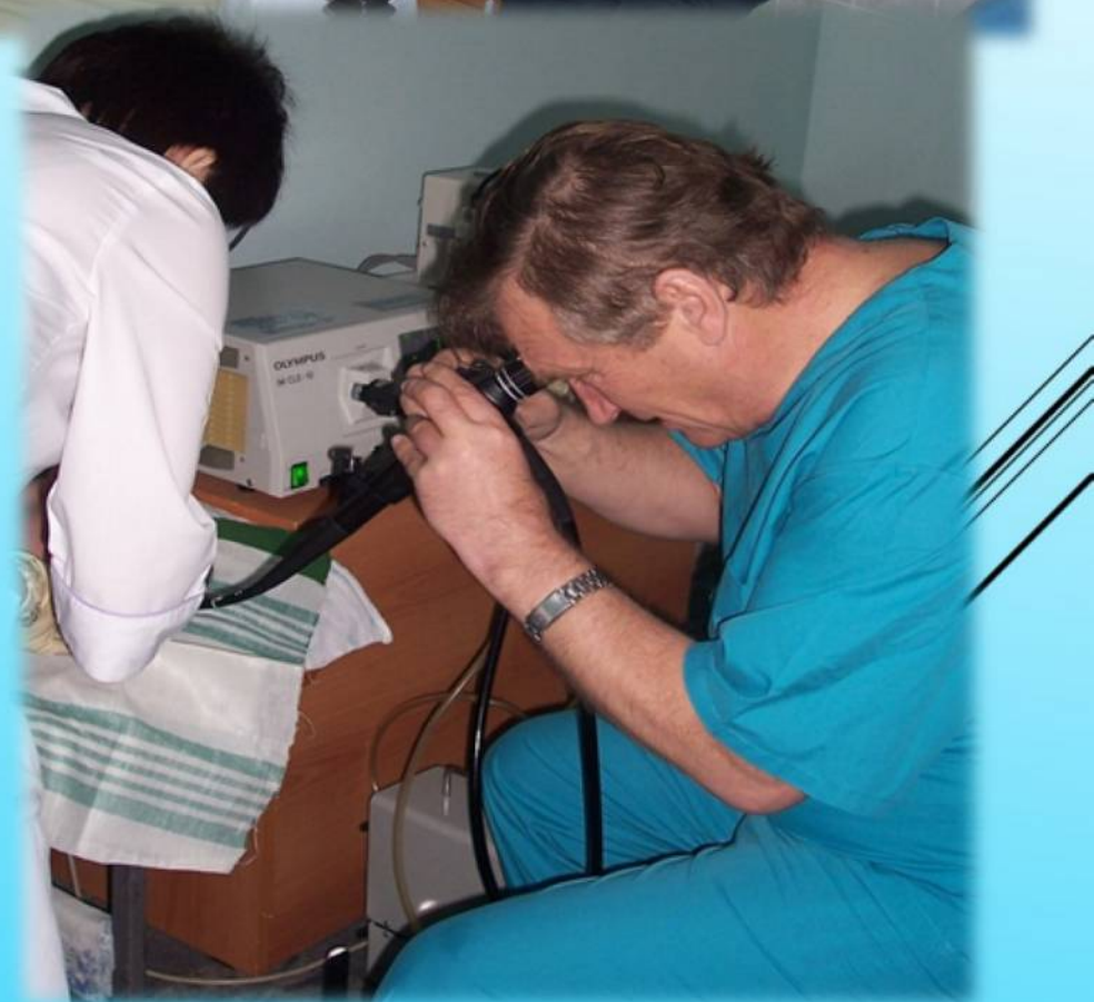
Врачи Октябрьской районной больницы проводят диагностические исследования, 2007 год