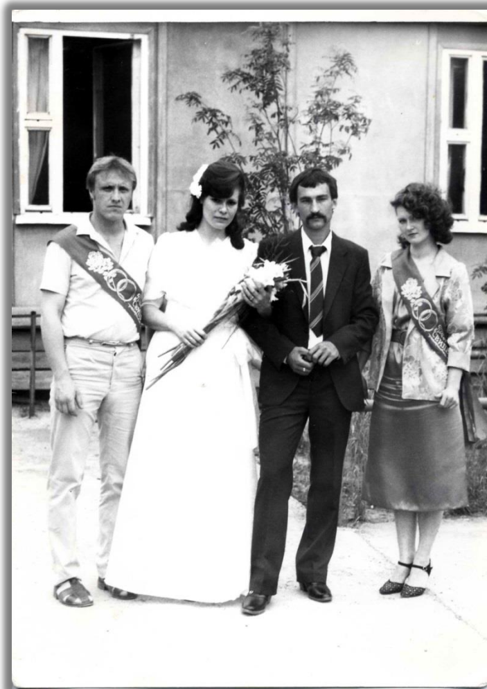
Одна из первых свадеб, зарегистрированных в Покачевском поселковом Совете. р.п. Покачи. 1987 г.