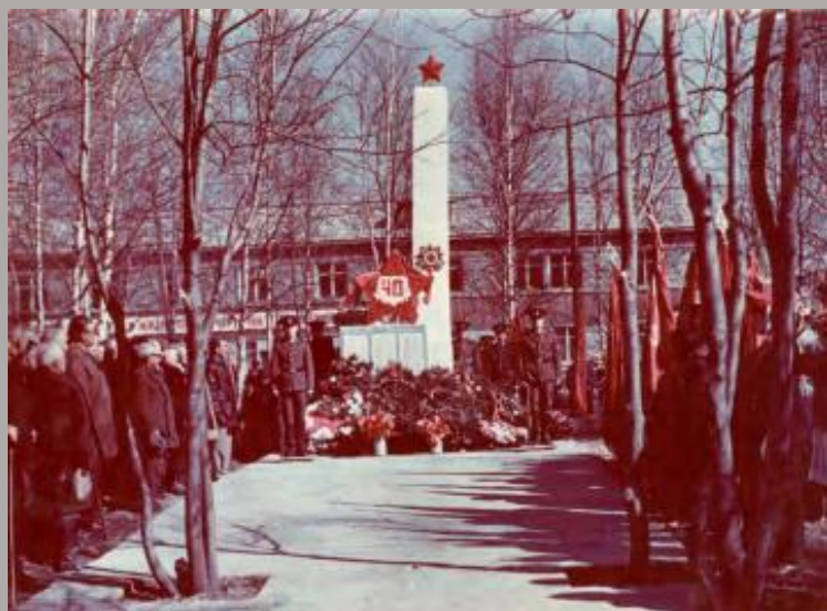
Обелиск землякам-октябрятам, погибшим в годы Великой Отечественной войны в центральном сквере. Дата 09.05.1985