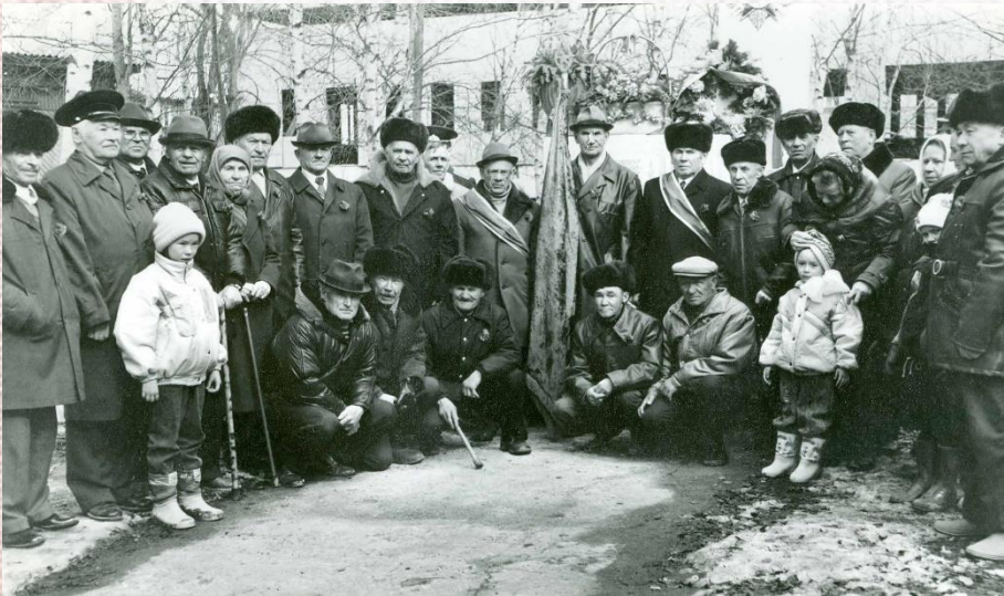
Основание: архивный отдел администрации Октябрьского района Ф.Фотофонд, Оп.1, Д.338.

Мы продолжаем серию публикаций из газеты «Большевистская правда» за 1942 год, «Микояновский район в годы Великой Отечественной войны», чтобы вспомнить ещё раз с помощью газетных строк о самоотверженности советских людей в годы войны в тылу. Они жили и работали с одной целью: всё для победы!