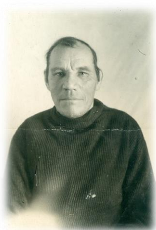
Основание: Ф.68, ОП.1, Д. 4.