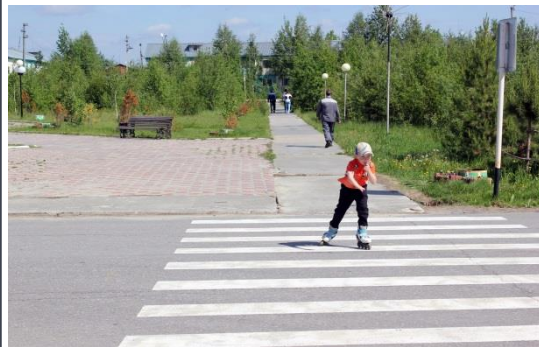
Комментарий при необходимости