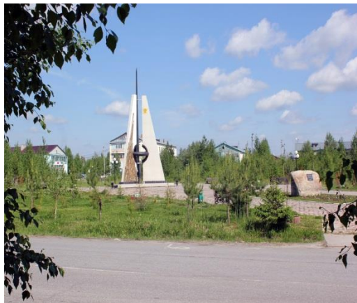
Комментарий при необходимости