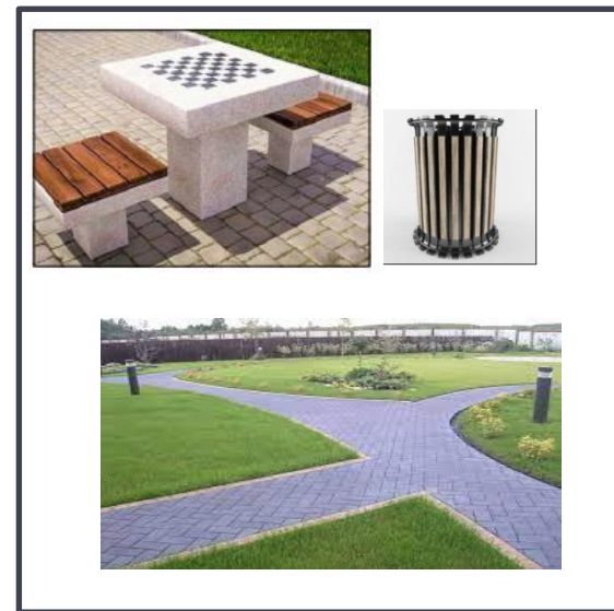
Зоны отдыха (настольные игры, шахматы), пешеходные дорожки, МАФы