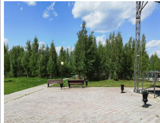
Комментарий при необходимости