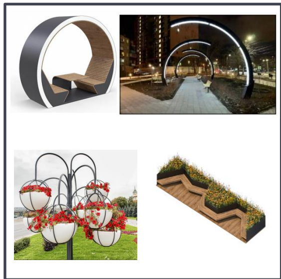
Садово-парковое освещение, зоны тихого отдыха