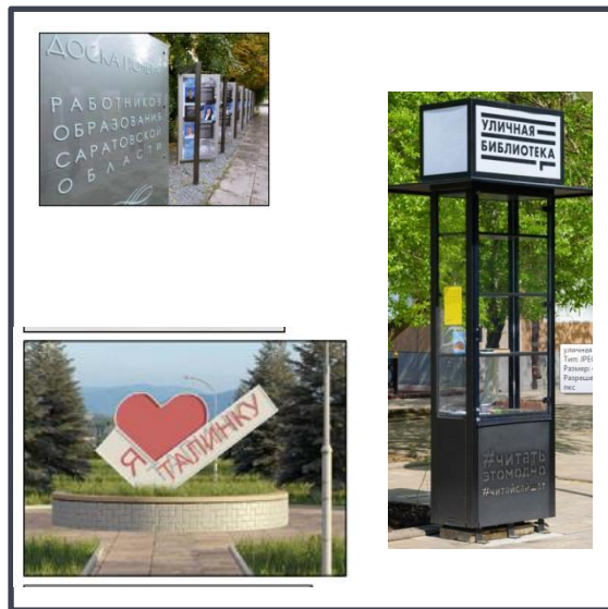
Аллея Славы, фотозона, уличная библиотека