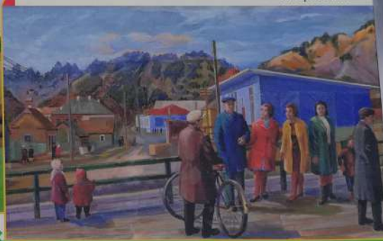
▼ «На пристани»