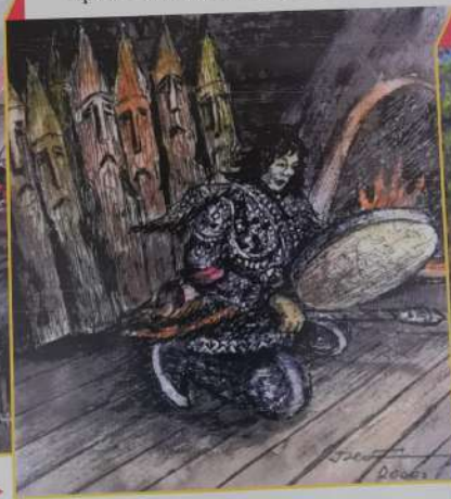
«Чёрный шаман» ▶