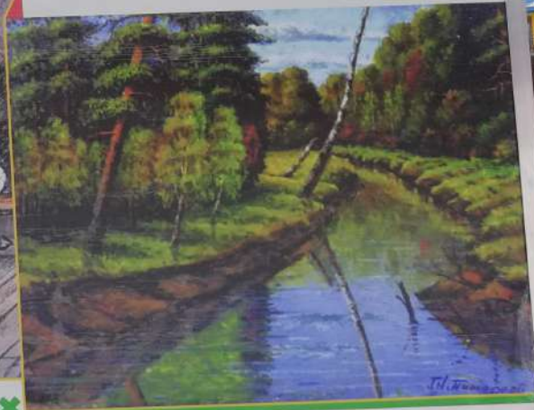
▼ «Река Тапсуй»