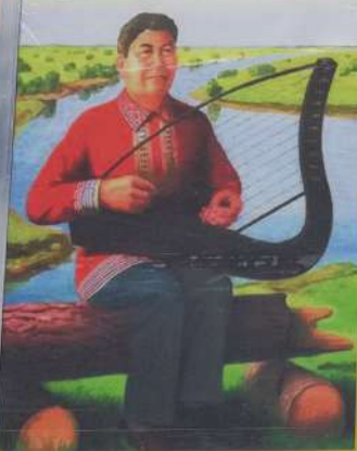
▲ «Мелодия торсаптыюха»