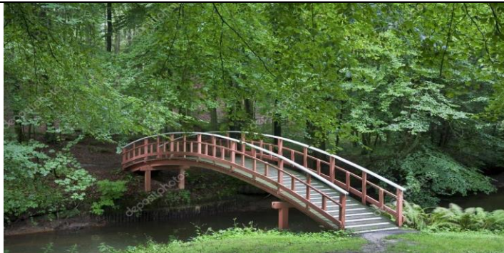
Планируемый пешеходный мост