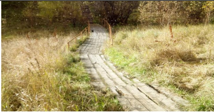
Место установки пешеходного моста и лестницы