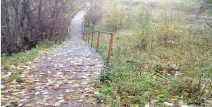
Место установки пешеходного моста и лестницы