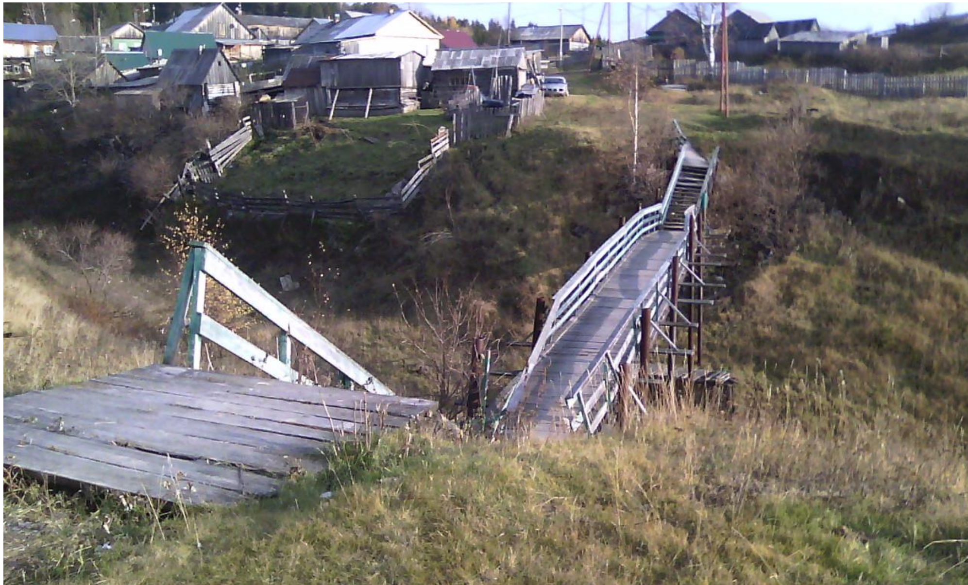
Фото пешеходного моста ул. Центральная – ул. Горная.