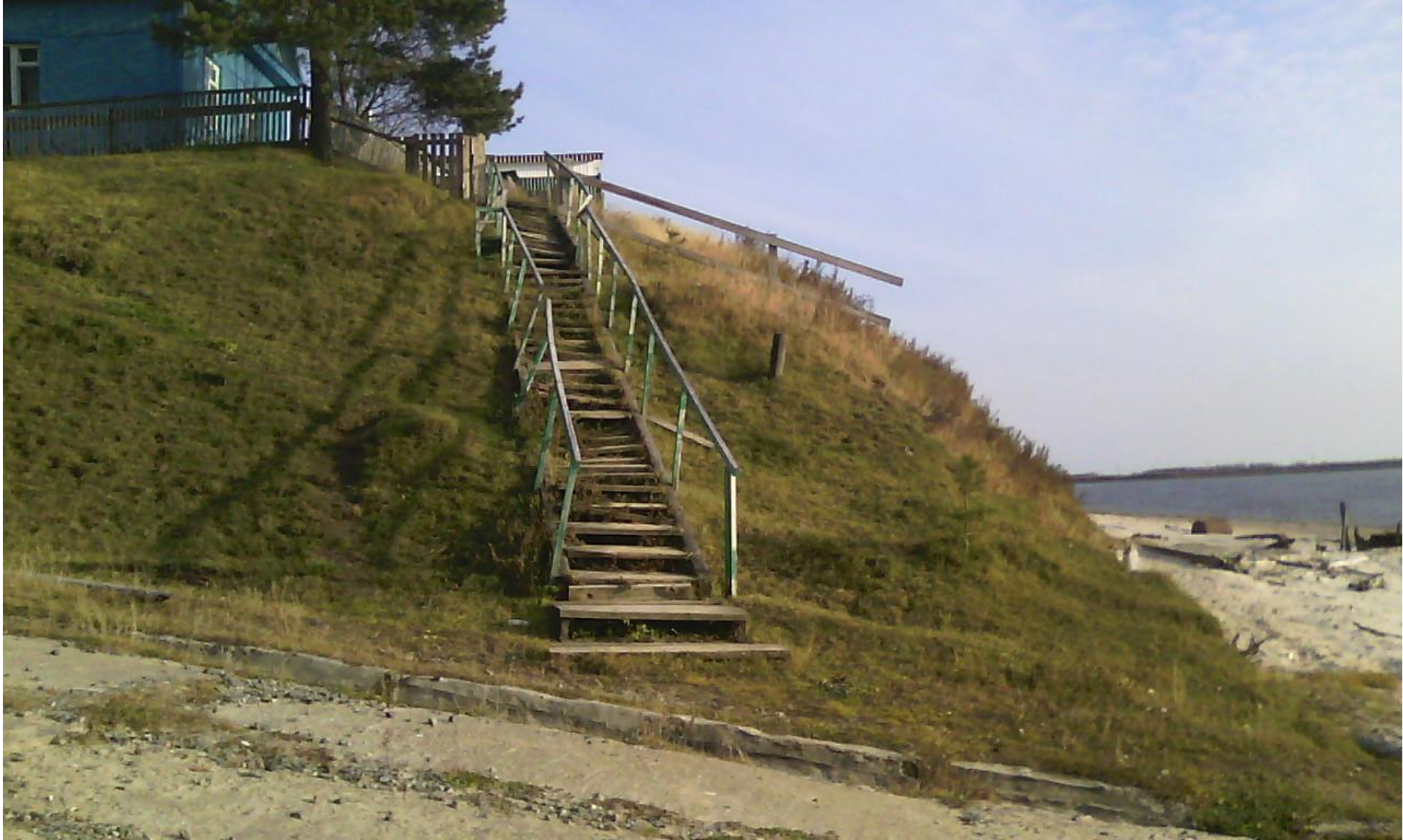
Фото лестницы причал – ул. Центральная