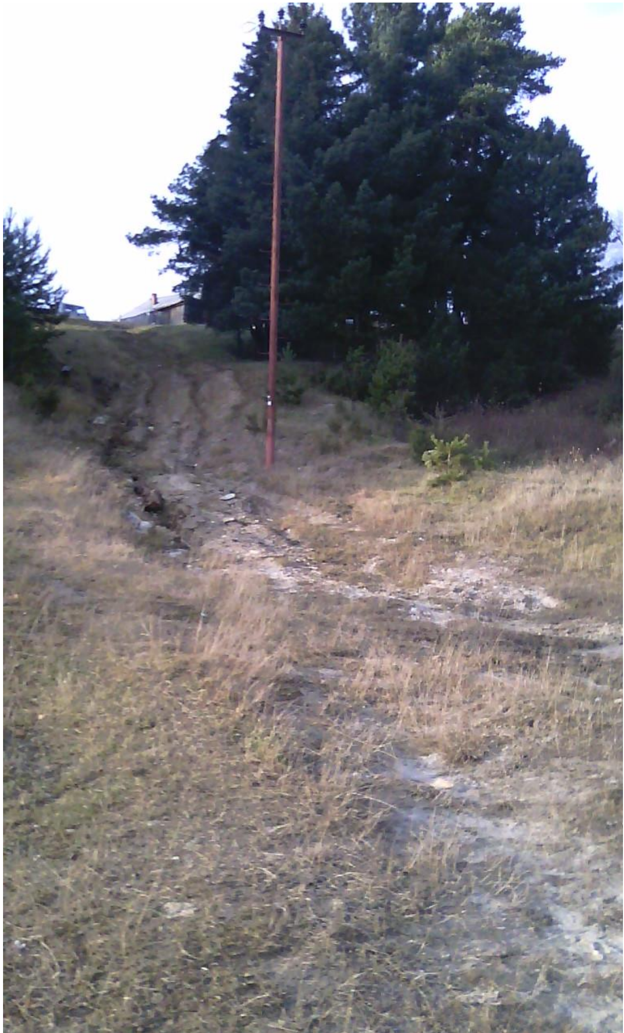
Фото лестницы ул. Центральная – пер. Обской.