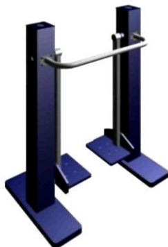
УЛИЧНЫЙ ТРЕНАЖЕР "ШАГОВЫЙ"

ТРЕНАЖЕР РАСТЯГИВАЕТ ГРУДНЫЕ МЫШЦЫ И ПОВЫШАЕТ ЭЛАСТИЧНОСТЬ МЫШЦ ПЛЕЧЕВОГО ПОЯСА. ГАБАРИТЫ: 1400x650x1500 ММ