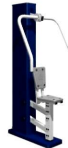
УЛИЧНЫЙ ТРЕНАЖЕР "ЖИМ ОТ ГРУДИ"

Тренажер используется для тренировки сердечно- сосудистой системы и увеличения выносливости. Габариты: 1485x727x1635 ММ