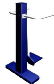
УЛИЧНЫЙ ТРЕНАЖЕР "МАЯТНИКОВЫЙ"

Тренажер очень эффективен при формировании сильного и красивого торса. Габариты: 1080x780x1805 ММ