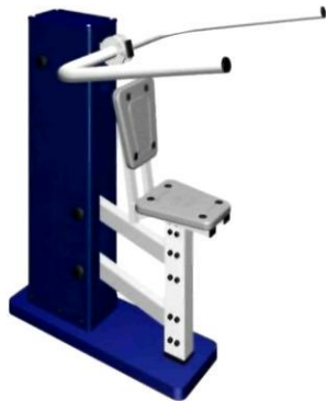
УЛИЧНЫЙ ТРЕНАЖЕР "БРУСЬЯ"

ТРЕНАЖЕР РАСТЯГИВАЕТ ГРУДНЫЕ МЫШЦЫ И ПОВЫШАЕТ ЭЛАСТИЧНОСТЬ МЫШЦ ПЛЕЧЕВОГО ПОЯСА. ГАБАРИТЫ: 1400x650x1500 ММ