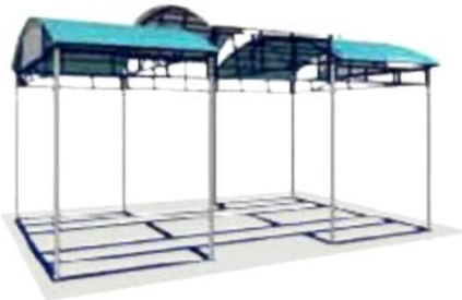
ТЕНЕВОЙ НАВЕС С РАМОЙ ДЛЯ ТРЕНАЖЕРОВ