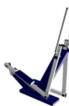
УЛИЧНЫЙ ТРЕНАЖЕР "ЭЛЛИПТИЧЕСКИЙ"

При использовании тренажера применяется принцип естественной нагрузки на опорно-двигательный аппарат занимающегося. Габариты: 760x1320x1200 мм