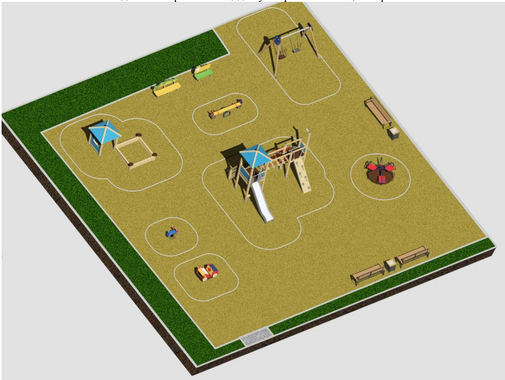
Эскиз детской игровой площадки ул. Промысловая 9, п. Заречный.