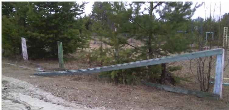
Текущее состояние территории